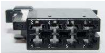
357 035 447 4,23 Euro