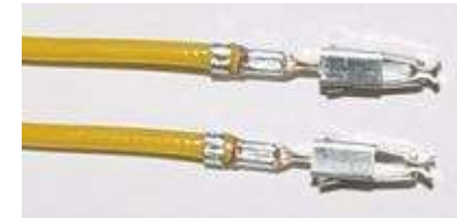
000 979 133 (1.0 mm 2 ) 000 979 225 (2.5 mm 2 ) 1,49 Euro