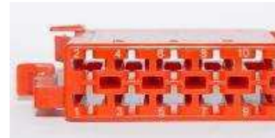
357 035 447 B 4,11 Euro