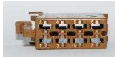
A 357 035 447 4,23 Euro